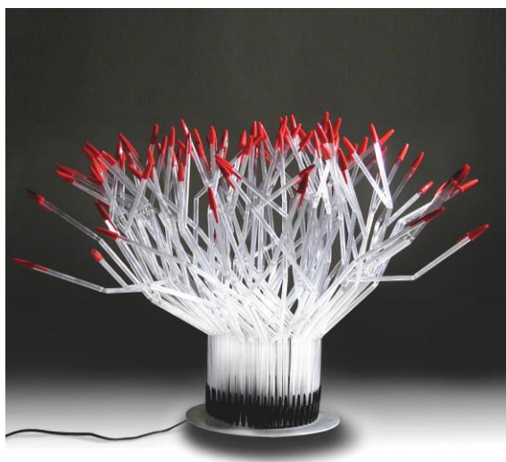
Légende des images en page 5