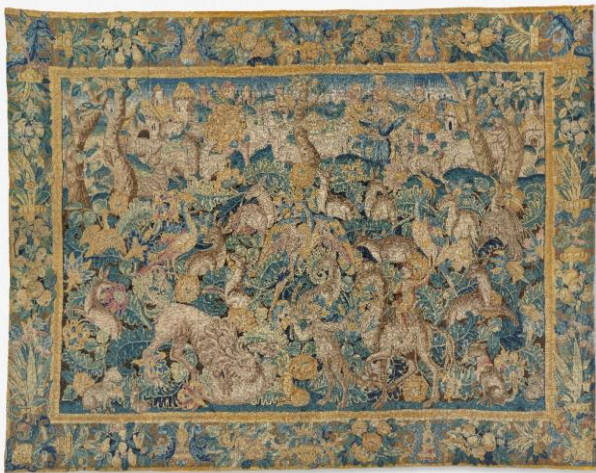
Le Bestiaire fantastique Seconde moitié du XVI e siècle Attribuée aux Pays-Bas méridionaux Laine et soie Collection Société BIC, achat 1983