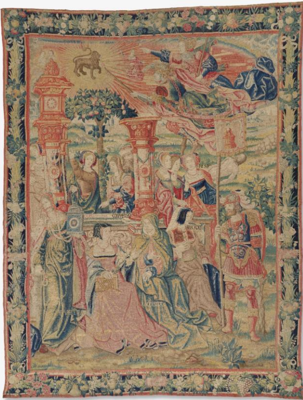
Les Vertus Vers 1535 - 1540 Pays-Bas méridionaux, Bruxelles D'après Bernard van Orley (vers 1488 - 1541) Laine et soie Collection Société BIC, achat 1989