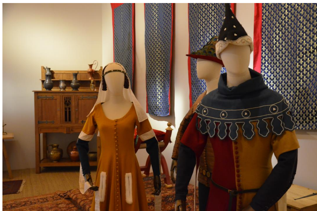
L'ambiance de la salle d'apparat reconstituée

Marie de Blois (1343/5-1404) est la fille de Charles de Blois, duc de Bretagne. Elle épouse Louis I er en 1360. À la mort de celui-ci, son fils aîné Louis II n'a que sept ans et Marie exerce la régence en faisant preuve d'une grande intelligence politique. Elle emmène ses fils à la cour de France, où Charles VI, leur cousin, les arme chevaliers (1385). En Provence, « la reine Marie, mère et gouvernante de Louis » lutte contre l'Union d'Aix qui s'oppose à la maison d'Anjou. Marie de Blois parvient à faire valoir les droits de son fils dans ses différents territoires, jouant de l'autorité et de la diplomatie. Elle meurt au château de Saumur et est inhumée dans le chœur de la cathédrale d'Angers auprès du tombeau qui abrite le cœur de son mari, dont le corps avait été enterré dans une église de Venise.