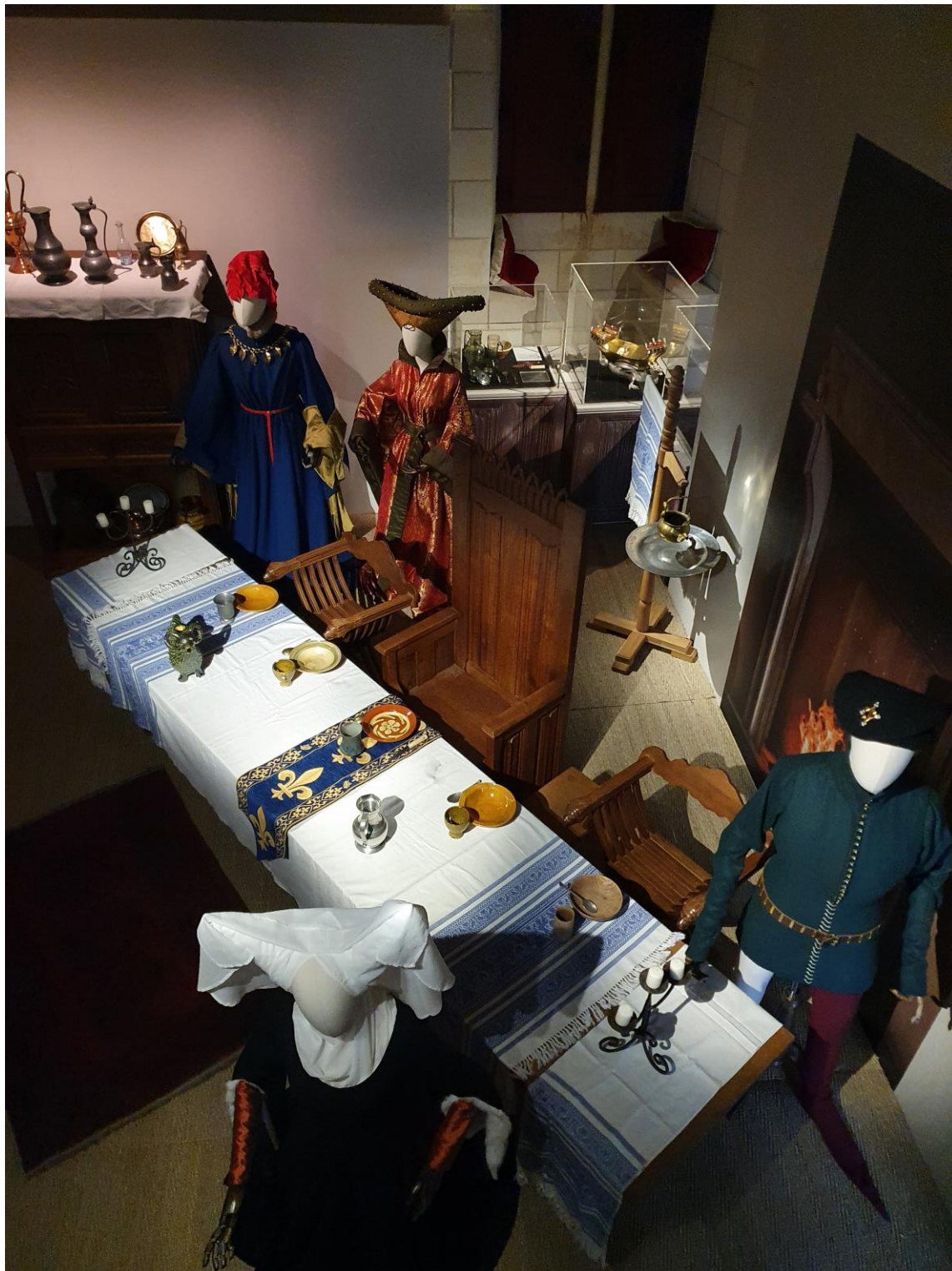
Le banquet