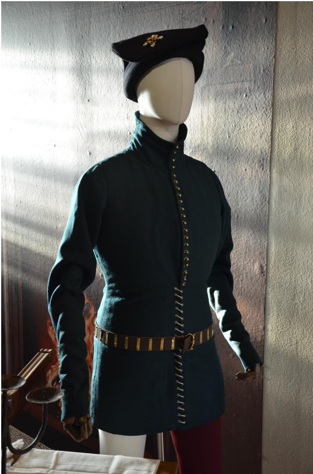
Costume, Modes d'autrefois