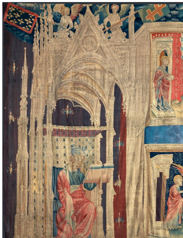
Détail de la 5 e pièce de la tapisserie de l'Apocalypse

Sur une grande chaire (trône) deux grands aigles d'argent doré tiennent dans leurs becs deux écussons émaillés, avec d'un côté les armes du duc et de l'autre la Croix à double traverse, exactement comme sur les étendards tenus par les anges sur la tapisserie de l'Apocalypse.