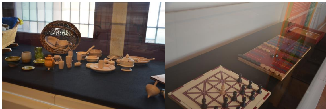
Fac-similés de jouets et jeux

On joue à des jeux de plateau : échecs, merelle, goupil et poules, jeu du moulin... Contrairement à nos boîtes de jeu, il n'y a pas de règles écrites et un même plateau peut servir à plusieurs jeux différents.