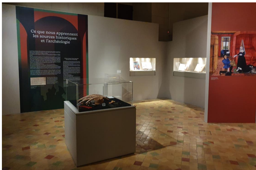
Salle d'introduction

Les découvertes archéologiques nous éclairent sur le décor du logis royal et notamment la présence de cheminées à hottes pyramidales, désormais disparues. Des vestiges d'éléments sculptés végétaux qui en proviennent gardent des traces de peinture jaune, rouge, noire et même dorée. Elles étaient donc peintes, comme les murs du logis. Des traces ténues d'un décor constitué d'arbustes, de touffes de végétation et de fleurs rouges à cinq pétales sont visibles dans l'embrasure d'une fenêtre de la salle suivante.