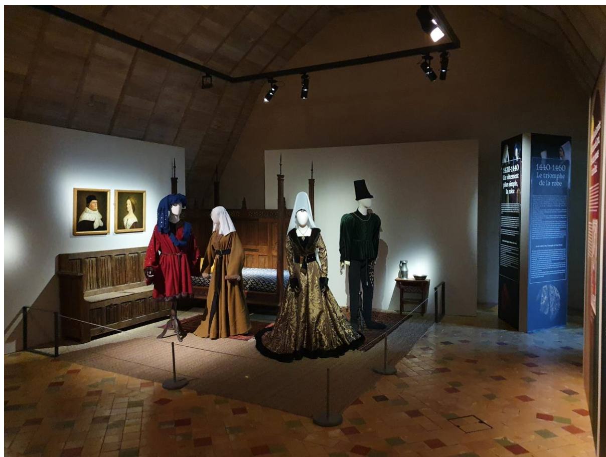
Chambre médiévale

Et toutes les équipes du Domaine national du château d'Angers.