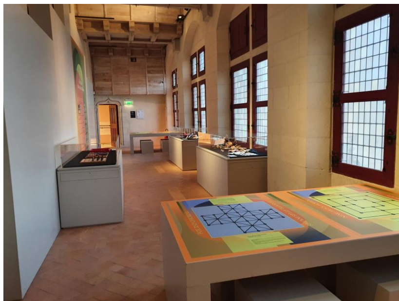
Jeux médiévaux pour tout public

Gestion des partenariats et du mécénat : Zohra Nabati-Raguin, château d'Angers