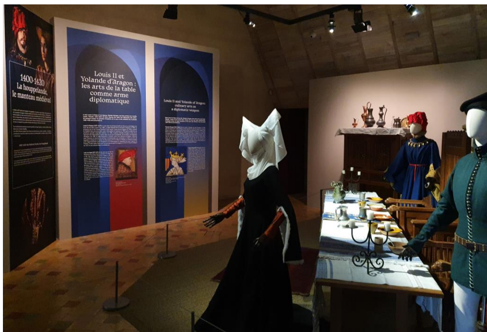
La salle du banquet

Yolande d'Aragon (1381-1442) , fille du roi Jean I er d'Aragon, est née à Saragosse. En 1400, elle est mariée avec Louis II d'Anjou afin de résoudre le conflit qui oppose les maisons d'Anjou et d'Aragon qui revendiquent toutes les deux les royaumes de Sicile et Naples. Elle élève en Anjou le futur roi Charles VII, auquel elle fait épouser sa fille Marie, et sur lequel elle garde ensuite une grande influence. Lorsque Louis II part en expédition en Italie, puis à sa mort en 1417, Yolande assure l'administration générale de tous ses domaines. Active dans les alliances diplomatiques et matrimoniales, elle finance l'armée de Jeanne d'Arc, œuvre au sacre du Dauphin et à la résolution de la guerre de Cent Ans. Amatrice de littérature, elle transmet ce goût à ses enfants, jouant ainsi un rôle clé dans le développement culturel de la cour angevine. Yolande d'Aragon meurt en 1442 à Saumur et elle est inhumée aux côtés de son époux dans la cathédrale d'Angers.