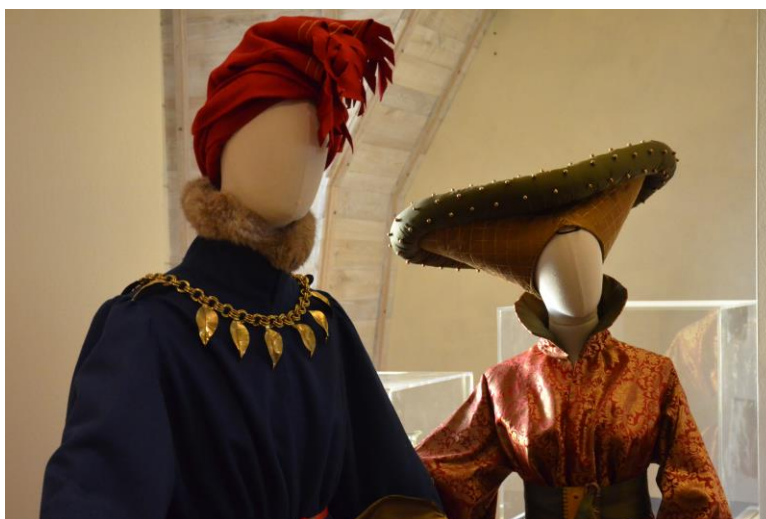
Costumes, Modes d'autrefois, © Anne-Christine Victor-Théonas / Château d'Angers

Les coiffes féminines adoptent des formes très variées telle que la coiffe « à cornette », « l'escoffion », encombrant et lourd, donc réservé aux oisives. Les hommes portent un chaperon roulé sur la tête en « crête de coq ».