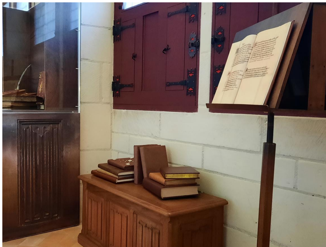
L'ambiance studieuse de la galerie du 1 er étage

Ses proches ont également accès à ses ouvrages. Louis de Beauvau, sénéchal d'Anjou, raconte qu'il a entrepris de traduire en français un petit ouvrage en italien de la bibliothèque du roi René.