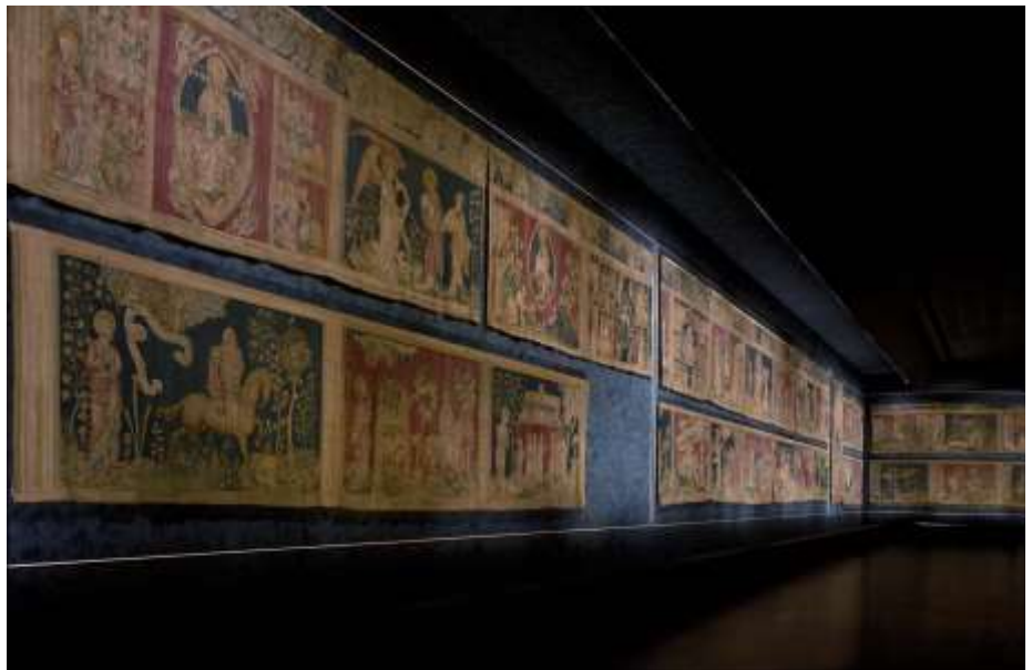
La tenture de L'Apocalypse

La tenture de l'Apocalypse est commandée par Louis I er d'Anjou, vers 1375. Plus qu'une simple illustration du texte écrit par saint Jean au I er siècle après J.C. (dernier texte du Nouveau Testament), la tenture de l'Apocalypse est avant tout une œuvre unique (la plus ancienne tapisserie historiée de cette dimension connue au monde) qui révèle le contexte historique, social et politique de la France au XIV e siècle. La guerre de Cent Ans transparait ainsi dans de nombreuses scènes, que ce soit à travers les éléments et les personnages représentés ou les symboles à double lecture.