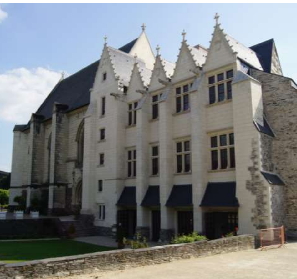
Logis royal – façade nord

Les édifices du centre de la cour se distinguent par l'emploi de la pierre de tuffeau pour une majeure partie de leur maçonnerie. Caractéristique géologique du bassin parisien dont l'Anjou se situe à la limite, le tuffeau est apprécié pour sa blancheur et une facilité de taille qui permet une riche décoration des façades.