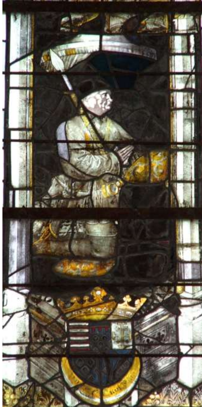
Le roi René, vitrail de la chapelle du château d'Angers, XVe

À partir de 1434, le règne du « bon roi René », duc d'Anjou, de Lorraine et de Bar, comte de Provence, roi de Naples, de Sicile et de Jérusalem, apporte un renouveau au Duché. Il s'efforce de rendre aux terres qui lui étaient dévolues richesse et prospérité. Le château d'Angers est l'objet de travaux continus entre 1450 et 1465. Le roi René met à la mode les manoirs de campagne.