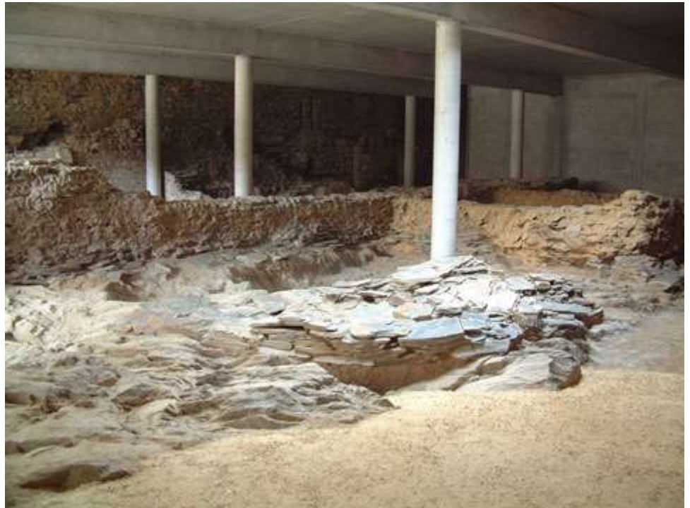
Les vestiges archéologiques

Les fouilles conduites en 2002 et 2003 ont mis au jour un cairn, situé à l'extrémité occidentale du promontoire rocheux qui dominait la Maine. Ce monument néolithique est une véritable tombe constituée d'au moins quatre chambres funéraires. Une des chambres contenait du mobilier : des poignards et haches polies en silex, ainsi que des céramiques. Un morceau de voie antique a aussi été découvert. Grâce à la datation du mobilier, de l'architecture et du Carbone 14, on sait que ce monument néolithique remonte à environ 4000 ans avant notre ère. Dans le prolongement du palais comtal, ont été découverts les vestiges d'une salle d'hygiène, chauffée par des tuyaux de terre cuite (X e siècle.)