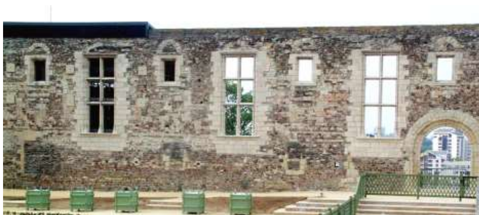
Façade de la salle comtale

Sous le règne de Jean Sans Terre, l'empire des Plantagenêt commença à s'effondrer.