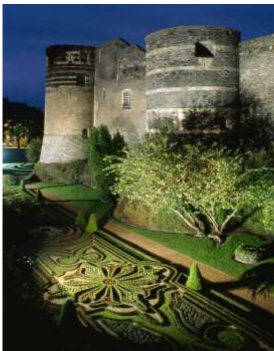
Le jardin des fossés au pied des remparts

Les fossés du château, autrefois réservés à la ménagerie du roi René, sont devenus un jardin orné de broderies à l'anglaise caractérisées par la présence de nombreuses fleurs.