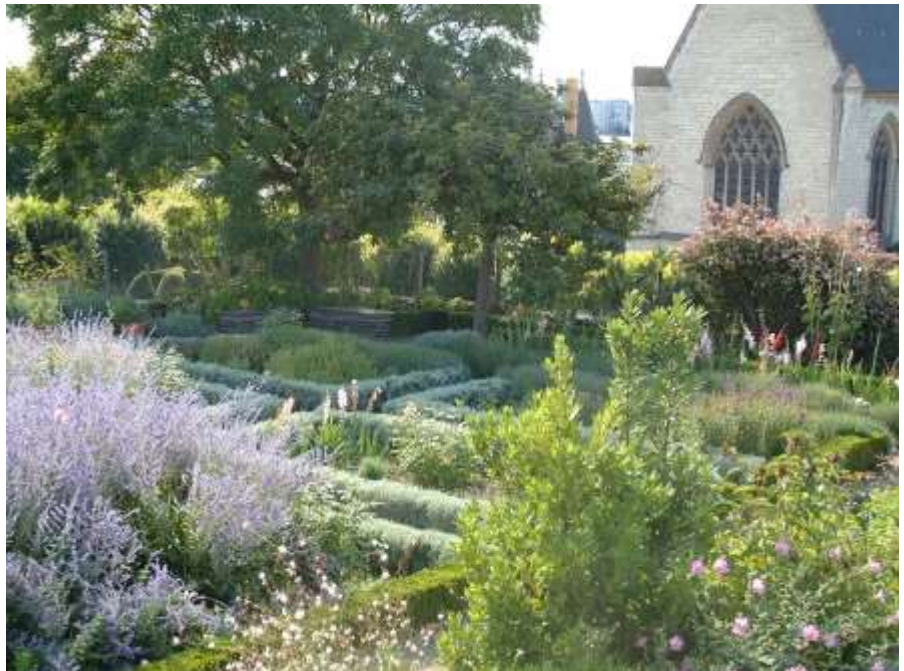
Le jardin suspendu

Sur le haut des courtines nord, à l'emplacement des terrasses d'artillerie, sont présentés trois espaces végétalisés. Le jardin suspendu présente des essences cultivées au Moyen Âge, ainsi que des plantes et des arbres importés par le roi René. Composé de platebandes de plantes mellifères, aromatiques, condimentaires, médicinales, tinctoriales, il atteste de la diversité des fonctions des plantes au Moyen Âge, qu'elles soient utilitaires ou symboliques. Il présente également les plantes utilisées en sorcellerie (plantes bénéfiques et maléfiques) ainsi que celles représentées dans la tenture de l'Apocalypse. Il fait écho aux jardins médiévaux par sa composition en parterres clos de bordures de buis ou de santoline.