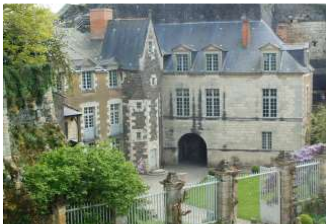
Le logis du Gouverneur

Dès la fin du XVe siècle, le roi nomme un gouverneur militaire qui réside dans le logis jouxtant la porte des champs.