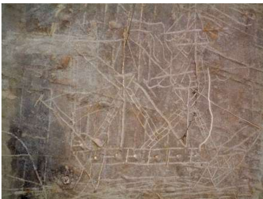
Graffiti - Tour 13

« Nous avons pris une mesure de sûreté contre les ennemis intérieurs de la Révolution, en les enfermant dans la chapelle et les tours de la citadelle. Là se trouvent pêle-mêle (...) des citoyens de tous états et de tous âges (...) c'est enfin l'assemblage le plus bizarre. Tous au nombre de plus de trois cents, sont réduits au pain et à l'eau, et couchent sept ou huit sur un matelas. » Cité dans : « La mémoire des anneaux, sept siècles d'enfermement au château d'Angers », catalogue sous la direction de Jean Brodeur, Monum, 2003.