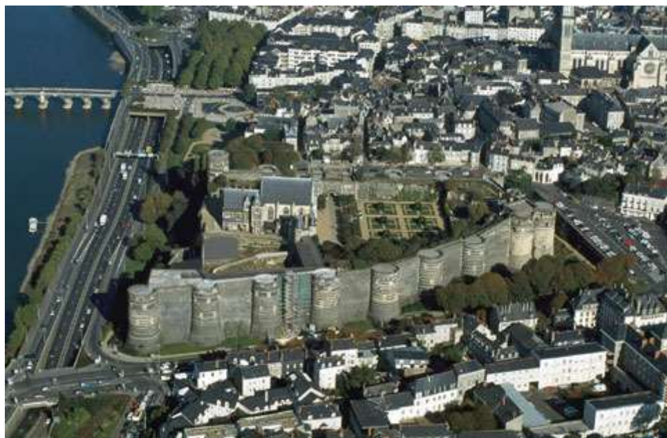
Vue aérienne du château d'Angers

La ville d'Angers est située de part et d'autre de la Maine qui connaît deux confluences, une en amont du site avec le Loir, la Mayenne et la Sarthe, une autre en aval avec la Loire.