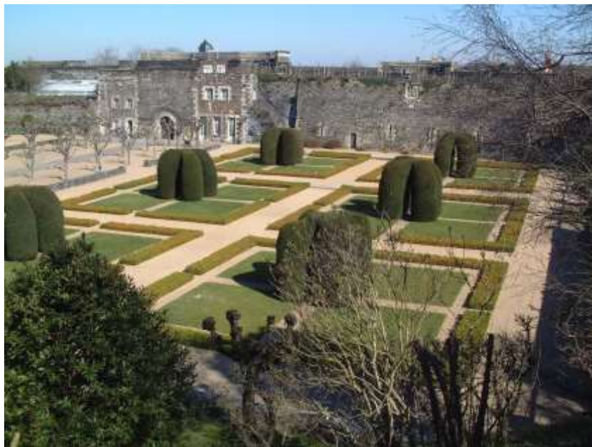
Le jardin régulier

Les jardins réguliers ont été créés par l'architecte Bernard Vitry en 1949. Situés dans la cour, les jardins réguliers sont composés de six carrés de pelouse, chacun surmonté en son centre d'ifs en tonnelle et ceint de banquettes de buis. Bien qu'ils soient de formes géométriques, ce ne sont pas des « jardins à la française ». En effet, il n'y a pas d'axe principal et ils ne forment pas de continuité avec les bâtiments alentours. Jardins contemporains, ils sont une interprétation artistique du jardin dit « de carreaux » et évoquent la composition du jardin médiéval.