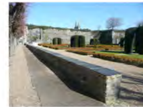
Muret de schiste dans la cour

- Plusieurs zones de repos sont à votre disposition: