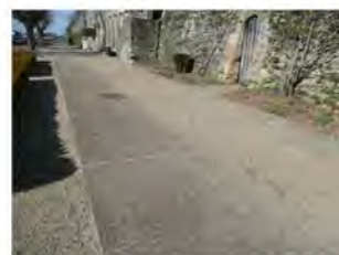
Bande de roulement

De l'accueil vers le restaurant, accessible par une rampe.